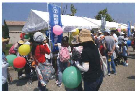
延長コード作りにお父さんお母さんも真剣

各団体ブースも同様で終了まで多くの来場者で賑わっていました。「ソレイユの丘」の発表によると1万人以上の来場者が有ったとの事です。終了後、水上ステージで閉会式が行われ“また、来年も開催する！！”と締めて、長い一日は終了しました。ご協力頂いた青年部、理事、組合員そして、関東電気保安協会の皆様ご苦労様でした。