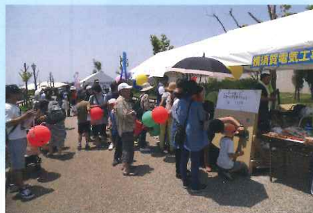
宝探して大当たり？！