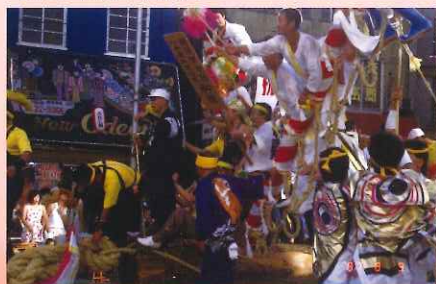
89 「横須賀市制 80 周年記念祭」