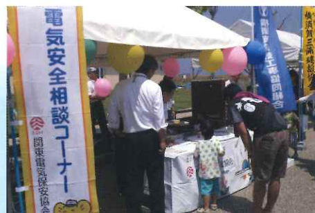
ソーラーパネルのNゲージ