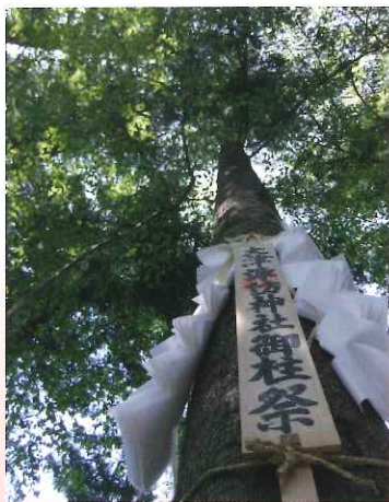
今年の風景