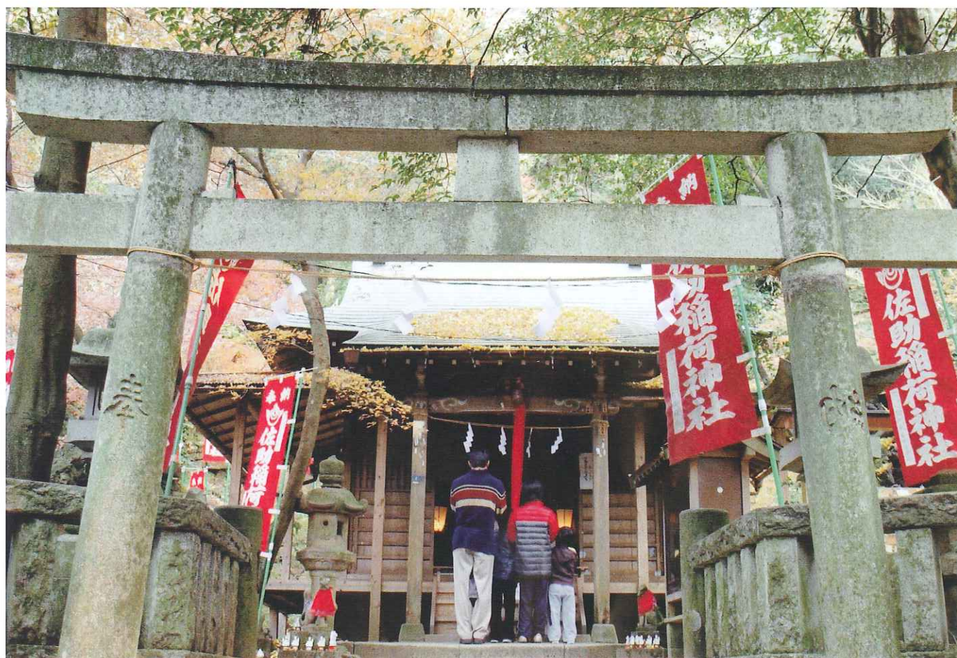
鎌倉・佐助稲荷神社「平和を祈って」