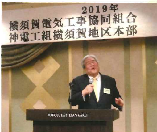
本島副理事長 三本締め